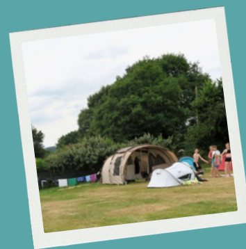
Hébergement en tente à la base de loisirs de la Dathée (14)