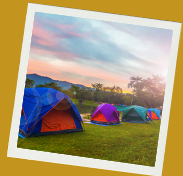
Hébergement en tente au centre Robert Hée- Claude Varnier (61)