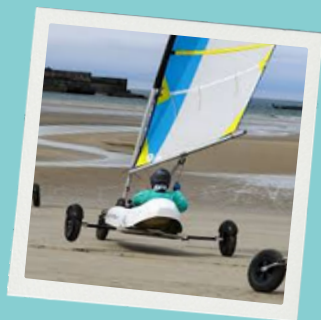
Char à voile (9-12 ans)