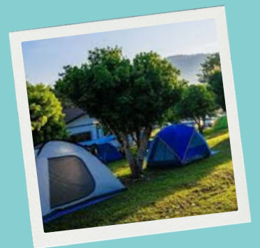
Hébergement en tente au PAJE centre nautique d'Asnelles (14)