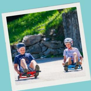
Ezyroller (6-8 ans)