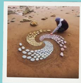
Découverte de la laisse de mer et land art