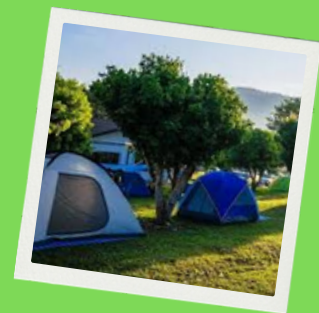
Hébergement en tente au Gasseau à St Léonard des Bois (72)