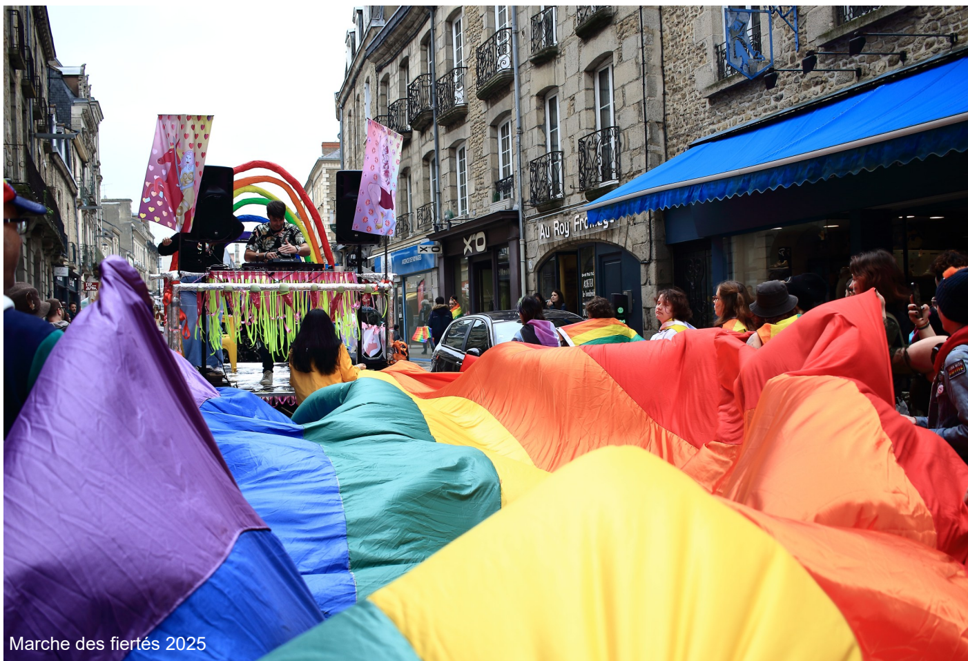
Marche des fiertés 2025