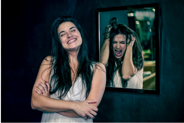
© David Alfaro — Reflejos del caos interno (Réflexions du chaos intérieur) Madrid, Espagne