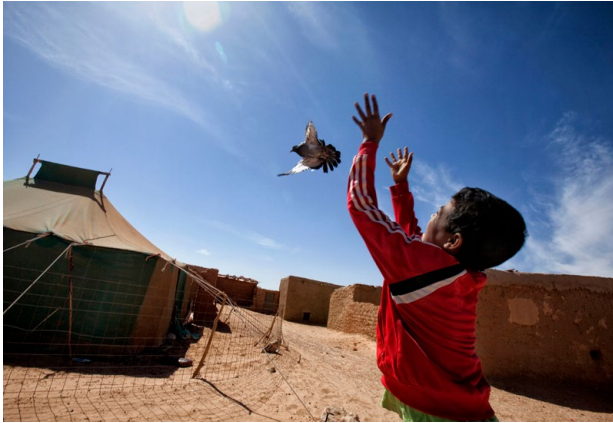
Terra e Libertà (Terre et liberté) Aousserd, Sahara occidental