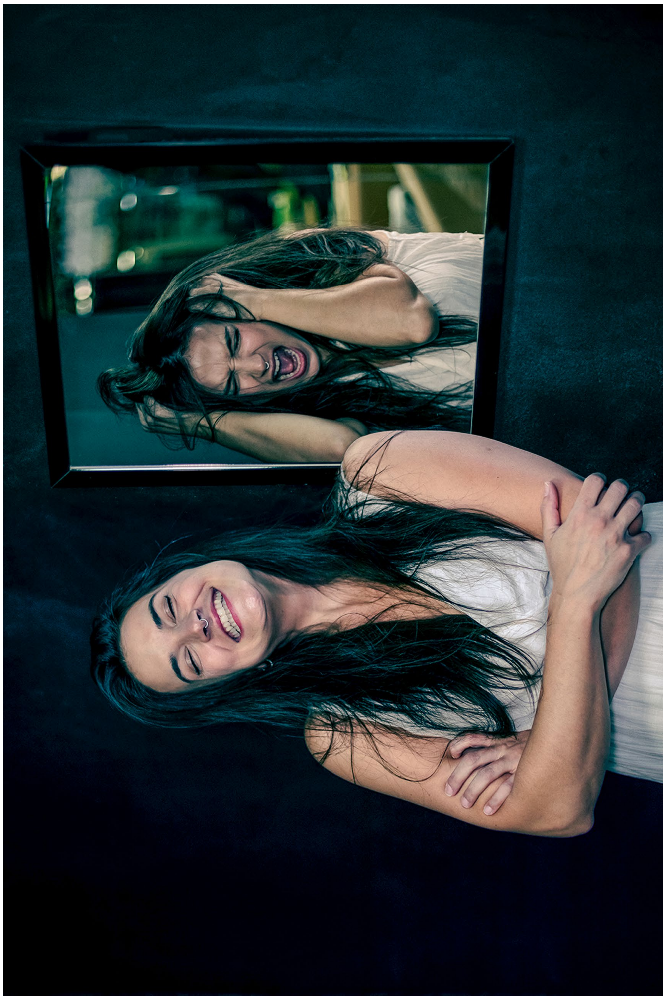
© David Alfaro — Reflejos del caos interno (Reflexions du chaos intérieur)