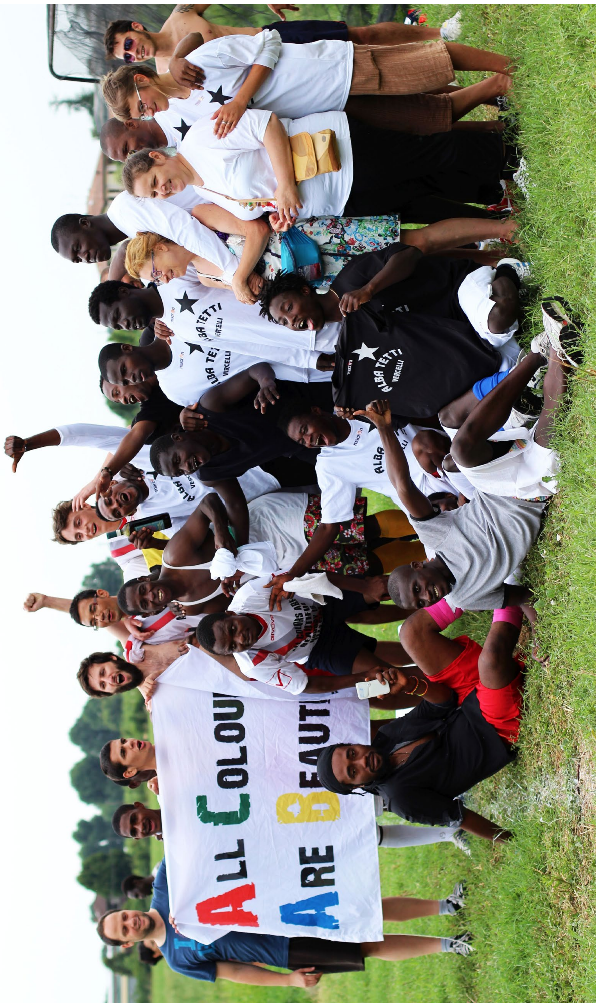
© Ladislav Tomićić — All colours are beautiful (Toutes les couleurs sont belles)