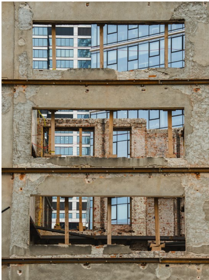
© Oskar Wangart — Postę? (Progrès ?) Wola (quartier de Varsovie), Pologne