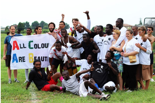
© Ladislav Tomičić — All colours are beautiful (Toutes les couleurs sont belles) Bosco Albergati, Emilia Romagna, Italie