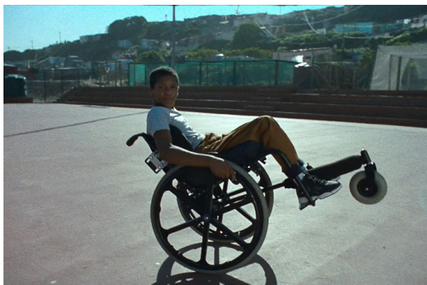
© Sam Pilling, Pulse Films - LE BAL/ERSILIA — #WeThe15 (Nous les 15)