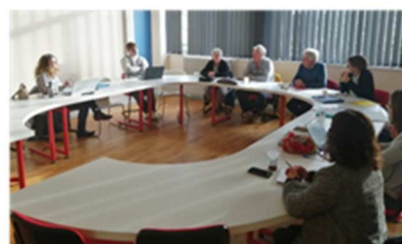
Accompagnement collectif DLA Manche