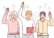
Méthodes participatives avec les jeunes