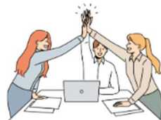
Accompagner les projets de jeunes

Les ateliers sont organisés en journée, en soirée ou en cycle de 3 à 5 journées et répartis dans différents secteurs du département afin de les rendre plus accessibles. Ils reprennent les thèmes abordés lors d'IMPEC Pro en les déclinant de manière plus opérationnelle à travers l'apport d'outils, de méthodes, de connaissances et d'échanges de pratiques :