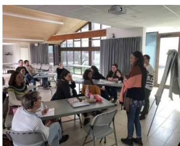
Session du CFGA 2023 Saint-Lô