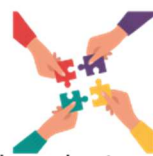
Place des jeunes dans vos organisations