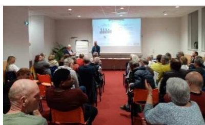
Soirée d'échanges sur le bénévolat à Mortain