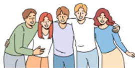
Psychodynamique de l'adolescence

Responsable de mission Engagement des jeunes Pôle Parcours citoyen