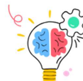
Identifier et valoriser parcours et compétences des jeunes