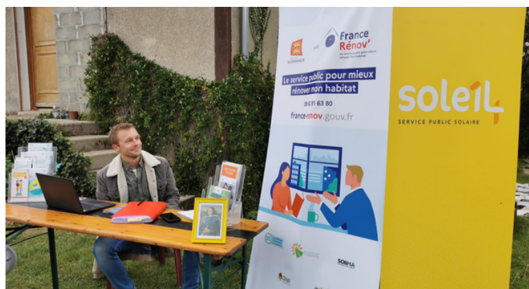
France Rénov' est le service public de la rénovation de l'habitat