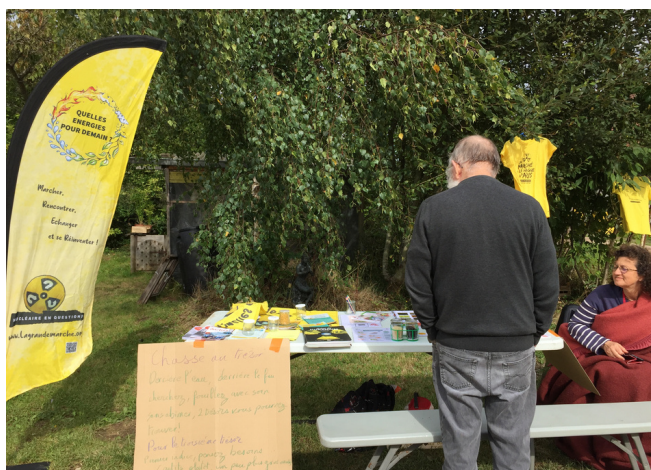
Nucléaire en question : chasse aux trésors sur les énergies