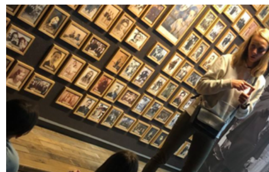
Accueil au Mémorial

Il existe d'autres partenaires obligés dans le cadre de l'offre touristique ?