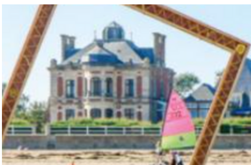
char à voile devant le centre