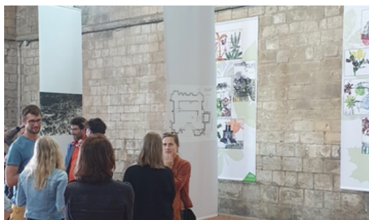
Projet Demain, avec le Musée de Normandie, 2022