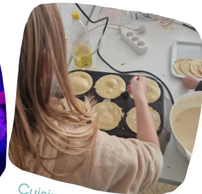
Cuisine pour le goûter