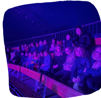
Sortie au cirque 100% humain