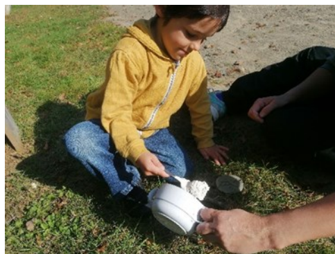
Ma première tartine de plâtre, c'est un jeu d'enfants