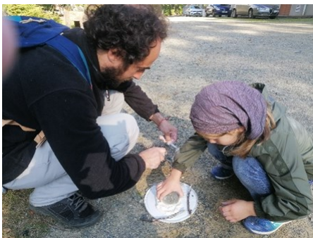
Mon papa c'est le plus fort !

La prochaine sortie en famille aura lieu le samedi 20 novembre de 14h30 à 16h00.