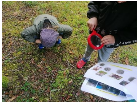
Attention, il ne faut pas louper des indices !