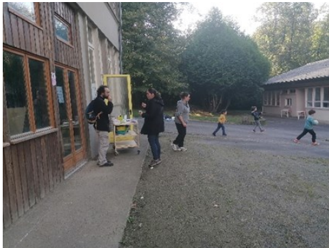
le café des parents pour refaire le monde !