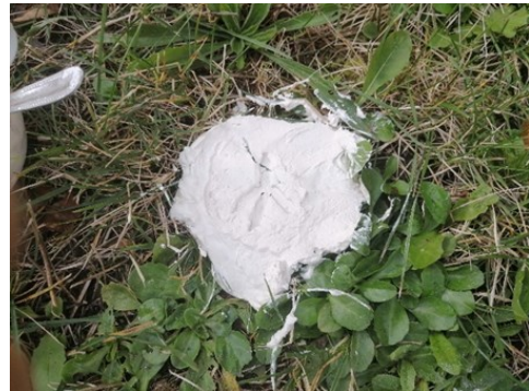
Et non ce n'est pas le pied de E.T mais bien celui d'une buse !