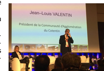
La séance d'installation