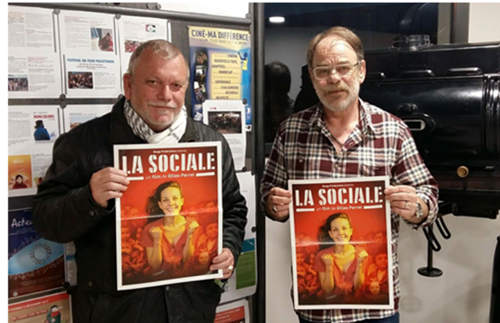
Bénévoles des associations Au fil de l'écran et Le Palace pour le point presse

A l'image de cette action fédérative réussie, grâce à la mutualisation des énergies des bénévoles des trois associations affiliées, cette soirée a permis sans