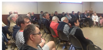
Le débat à Equeurdreville le 7 juin

de l'écran ». A la fin, tous les participants, candidats et citoyens, ont exprimé leur satisfaction pour la bonne tenue de ce débat.