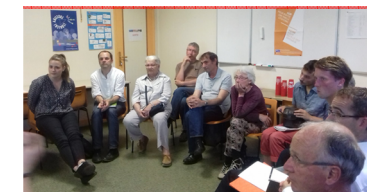
Le débat à Saint-Lô, le 1er juin

interpeller directement les candidats présents.