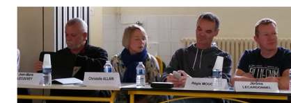
Les administrateurs de la fédération 50 en séance

Ces différentes réunions permettent d'assurer des échanges et d'enrichir nos réflexions, mais aussi de créer un lien fort entre les services, les projets régionaux et départementaux et le territoire de proximité représenté par la fédération de la Manche.