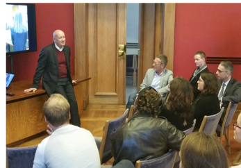
Le temps d'échange avec le Préfet

Des jeunes témoignent de leur engagement avec le Préfet de la Manche