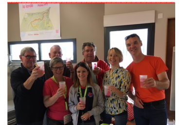
L'équipe de bénévoles de la fédération et salariées militantes

L'Ufolep 50 était enthousiasmée de voir la Fédération de la Manche s'investir dans l'organisation de sa manifestation phare.