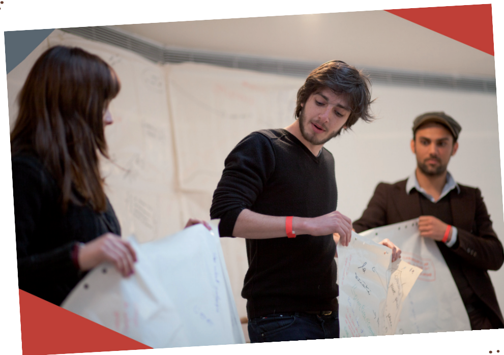
Conception graphique : La Ligue de l'enseignement - 2018

Formation organisée par le Collectif d'Acteurs pour la Formation Associative en Région