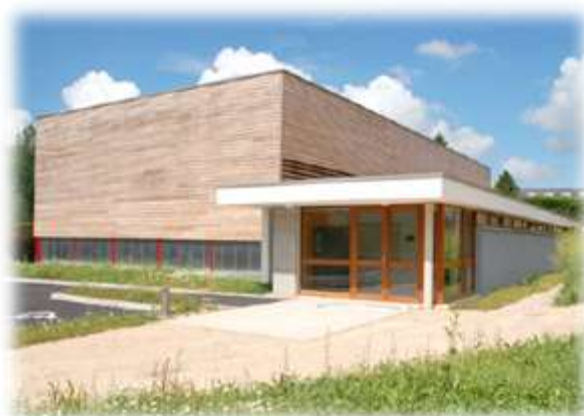
Gymnase de Bonnebosq