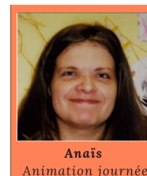
Anaïs Animation journée