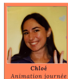
Chloé Animation journée