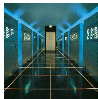
U.É. - Musée de la Seconde Guerre mondiale