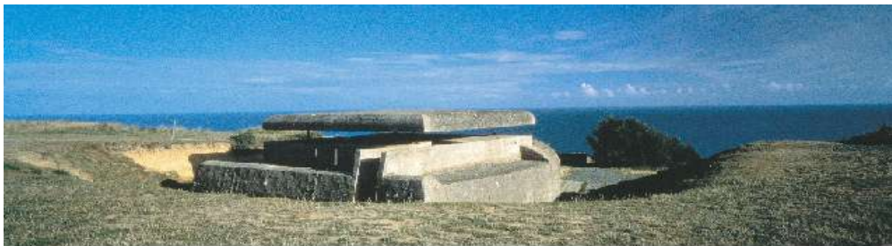
Batterie et canon de Longues-sur-Mer

La batterie allemande construite sur un plateau sans arbres, sur le sommet d'une pittoresque falaise comprend 4 canons toujours pointés vers la mer et un poste d'observation.