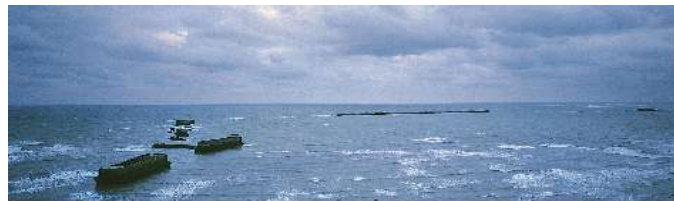
Le port artificiel d'Arromanches

Il a été édifié à l'endroit même où fut implanté le port artificiel dont on peut encore voir les vestiges à quelques centaines de mètres du rivage. Les maquettes expliquent le fonctionnement de ce port qui fut le plus important du Monde pendant les quelques mois qui ont suivi le Jour J.