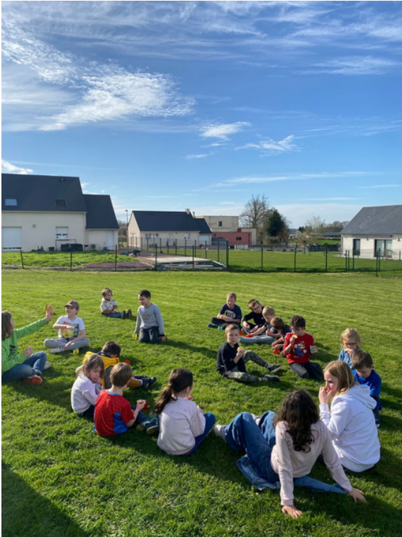
Le retour du beau temps et des goûters dehors !