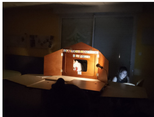
Spectacle de marionnettes créé par les enfants de l'IEM

OUVERTURE DES INSCRIPTIONS D'ÉTÉ TRÈS PROCHAINEMENT POUR LES DEUX CENTRES DU PÔLE ENFANCE JEUNESSE !