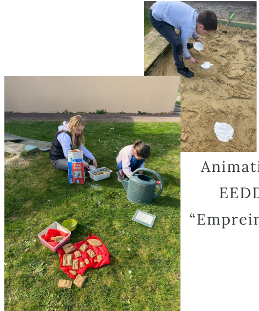
Animation EEDD "Empreintes"